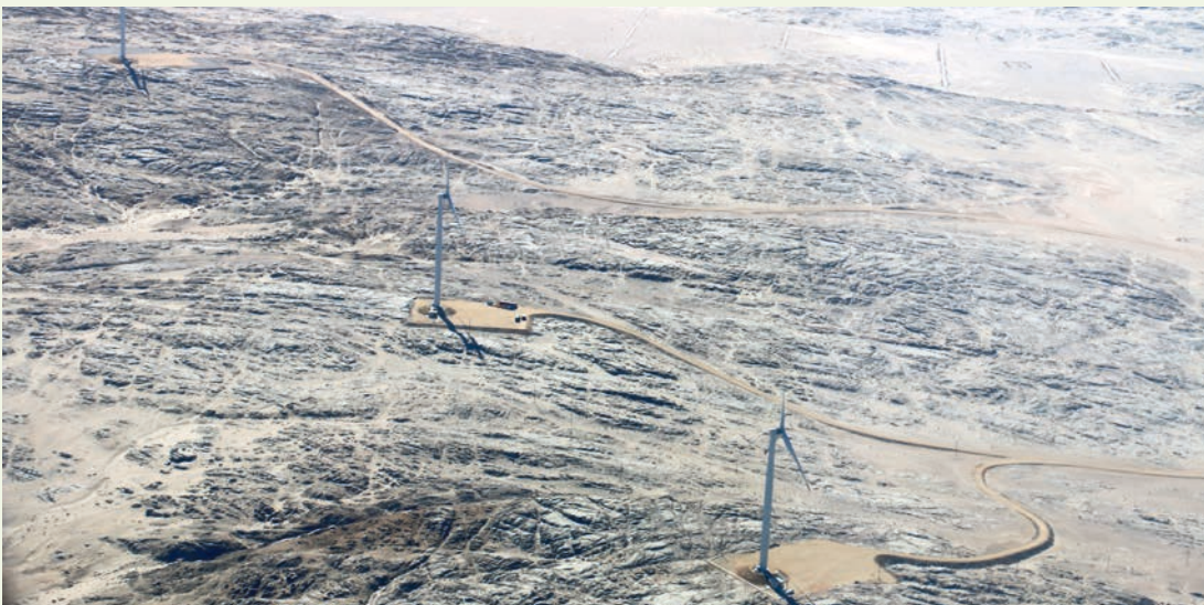
Windkraftwerk Lüderitz, Namibia