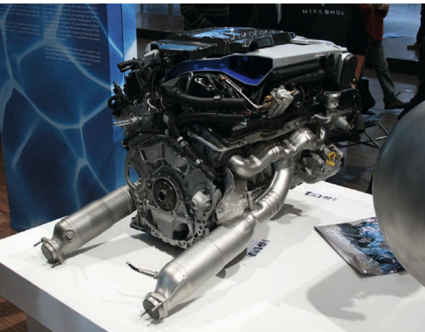
Zu teuer, zu wartungsintensiv, zu ineffizient. Wasserstoffmotoren im Automobilbereich gehören ins Abstellregal.