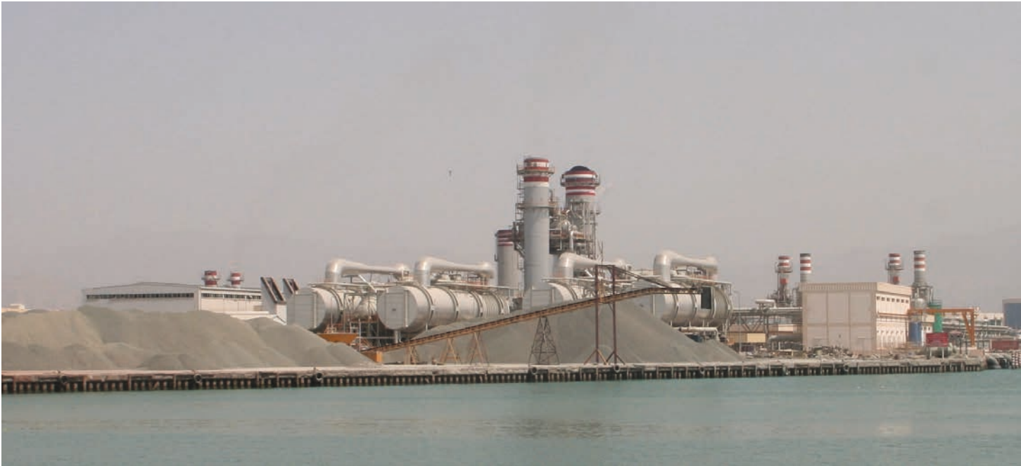
Entsalzungsanlagen für die Wasserstoffproduktion brauchen klare ökologische Vorschriften und feste Vereinbarungen zur Trinkwasserversorgung der Lokalbevölkerung.